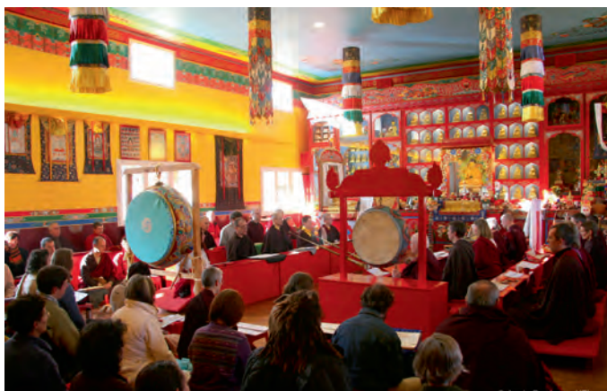
Temple de Laussedat