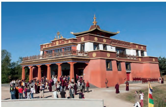
Le Grand temple