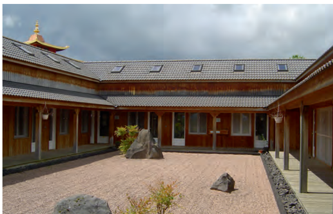
Ermitage Pendé Ling